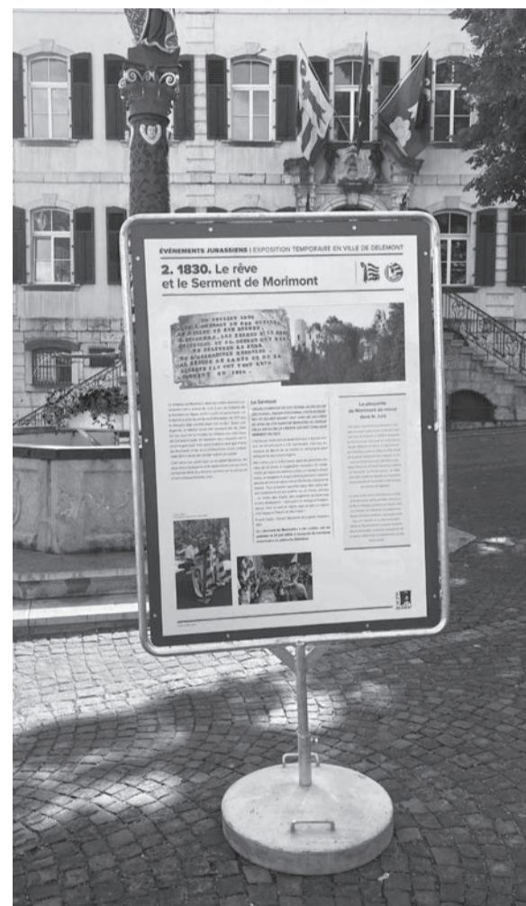
Un panneau de l'exposition temporaire en Vieille Ville

Service de l'urbanisme, de l'environnement et des travaux publics (UETP)