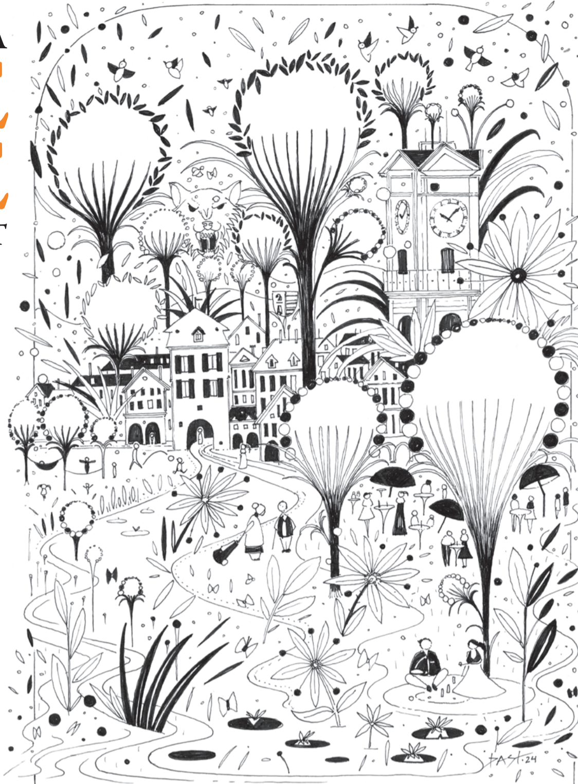
Illustration: Bastien Nusbaumer