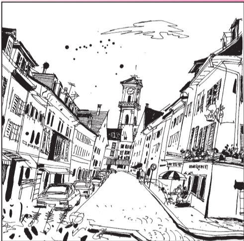
Illustration: Liuba Kirova

Les Dits de Saint-Marcel Georges Pélégry, 1989