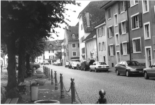
RUE DE L'HÔPITAL