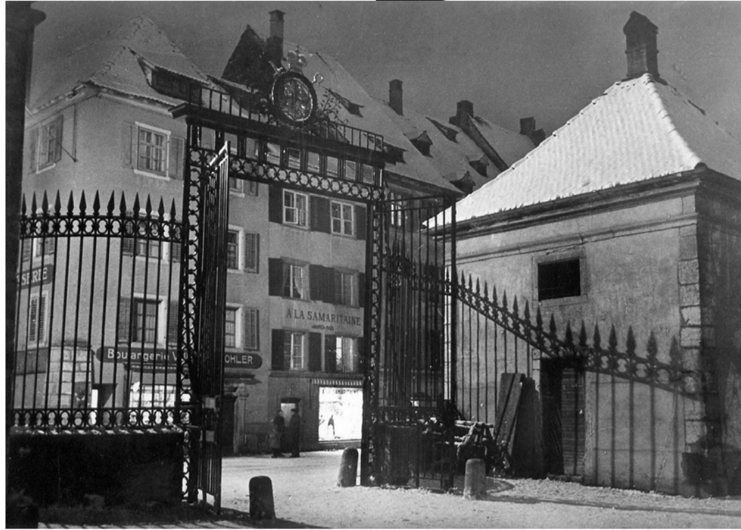
Souvenir de Max Meury. Avant d'être preneur d'images pour la TV, il avait logé en Vieille Ville son atelier de photographe. Avant de magnifier sur les écrans romands les paysages jurassiens, il avait en noir et blanc exprimé la douce atmosphère de nos espaces et de nos murs.

Cinq autres boutiques ont été présentées dans notre précédent numéro