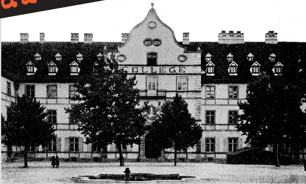
Au centre de la façade, les armoiries de Delémont tenues par les deux sauvages, peintes en 1893; au-dessus, le balcon et sa grille; plus haut, l'inscription Collège; au fronton, l'horloge n'a pas encore remplacé les deux yeux-de-boeuf.

En 1860, on demanda au peintre Jean Klein de présenter sur la façade les armoiries de la ville, la crose d'argent sur fond de gueules. On n'avait pas les moyens de les sculpter comme en 1718, on se contenta de les peindre. Elles ne furent pas mises entre les pattes de lions, mais entre les mains de nos sauvages. Plus haut, à la base du fronton, on inscrivit en grandes lettres: Collège. Les armoiries delémontaines tenues par les sauvages furent repeintes en 1893 par Drexler et en 1909 par Armand Schwarz. Elles disparurent lors de la