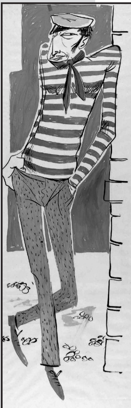
Bovée. Décoration de bistrot. Carnaval 1958.

Les deux expositions sont ouvertes, du mardi au dimanche de 14h à 17h, jusqu'au 24 février.