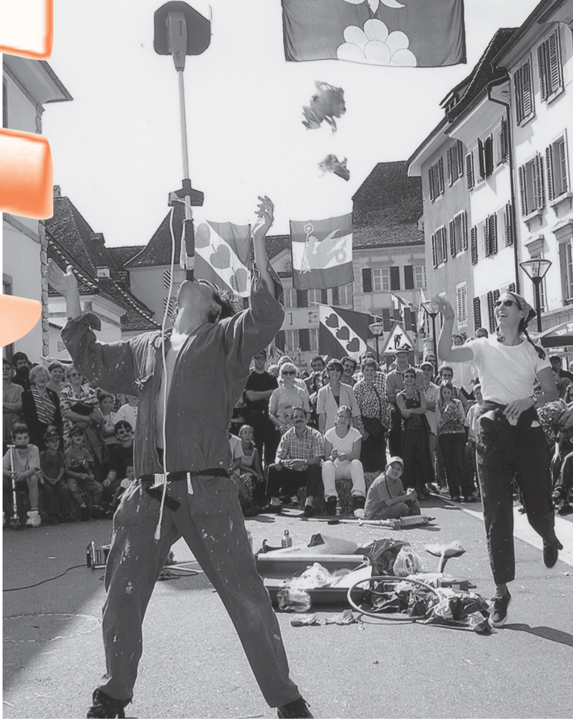
Artistes de rue.

La Vieille Ville accueillera 5 amicales de patoisants, le dimanche 7 septembre, à l'occasion de la 9e Fête cantonale du patois. Rencontre sympathique des Ajoulots, des Taignons, des Vadais, des Prévôts et des Belfortains. La messe de 10h15, à Saint-Marcel, à laquelle bien sûr tout le monde est convié, sera dite en patois, avec homélie de l'abbé Jacques Ouevray. Après la messe, sur la place de l'Eglise si le temps le permet, concert apéritif par les trompes de chasse Saint-Hubert. Les patoisants se réuniront à Saint-Georges pour le banquet officiel et la proclamation des résultats du concours littéraire.