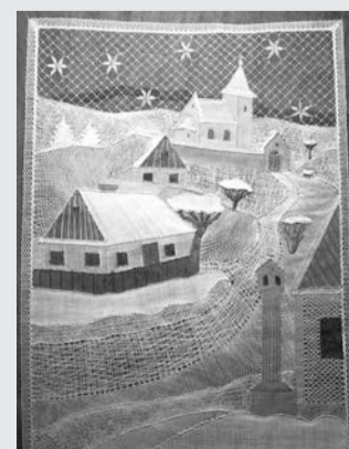
«Silent night», Zdenek Dolezal