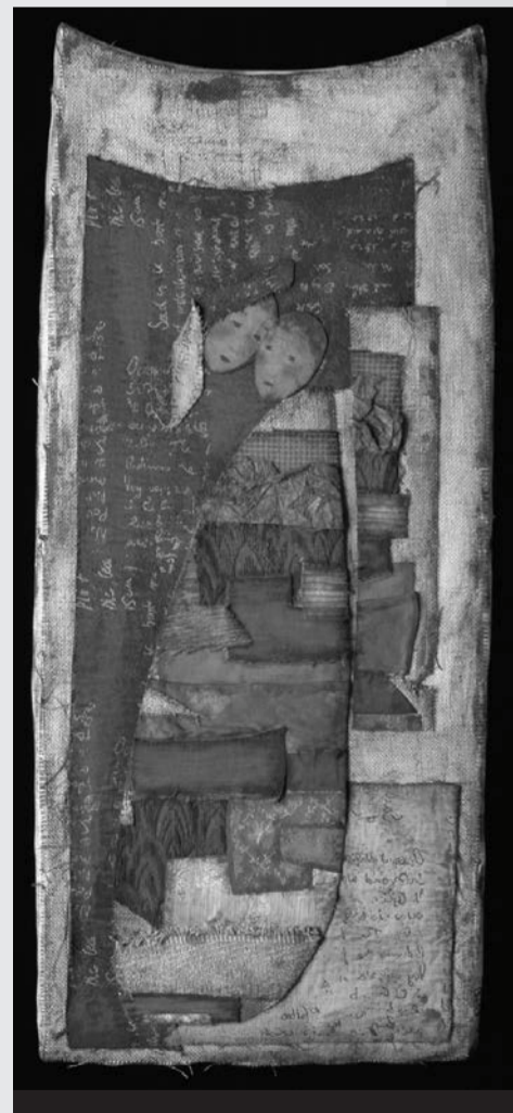
«L'Absence», Catherine Bihl

Exposition au Musée jurassien, du mardi au dimanche de 14 à 17h, jusqu'au 13 février.