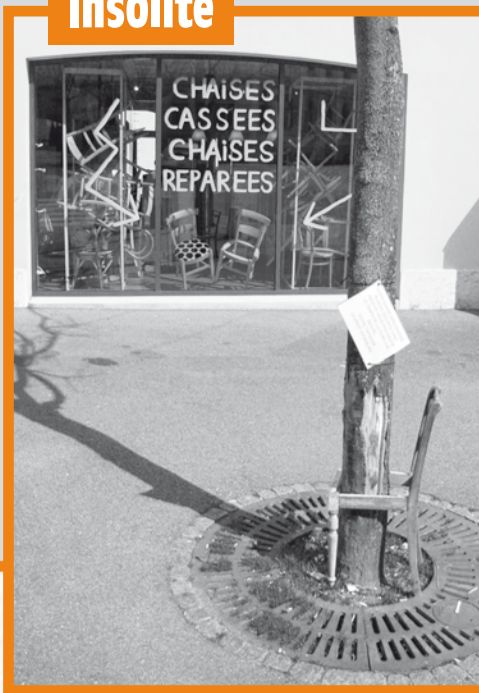
Accro(c) de la chaise