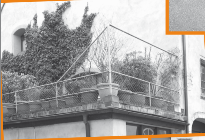
Le Jardin des Plantes version rue des Granges