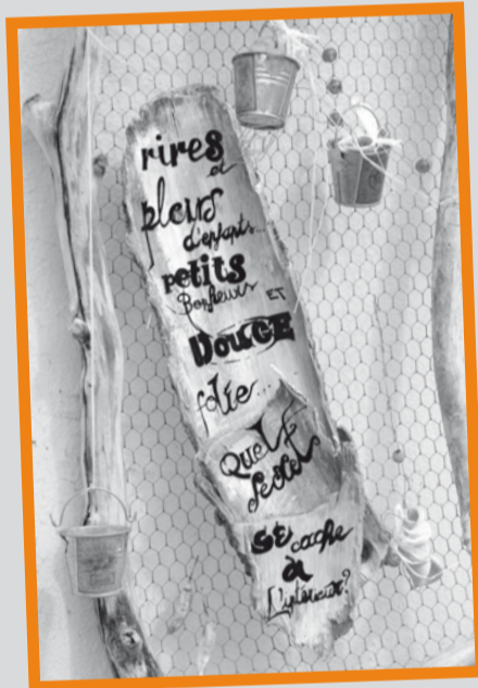
Folle et créativité font le numéro 10

Ce Journal est important, il participe à la vie de la Vieille Ville. Par ses articles et images, chacun sait qu'«en ville», il se passe de nombreux événements. Les annonceurs y trouvent le moyen de promouvoir leurs prestations. Si par un don vous avez envie de soutenir le Journal de la Vieille Ville: Banque Raiffeisen Région Delémont, CCP 25-2133-0, Compte 18962.23 Mention: Journal de la Vieille Ville