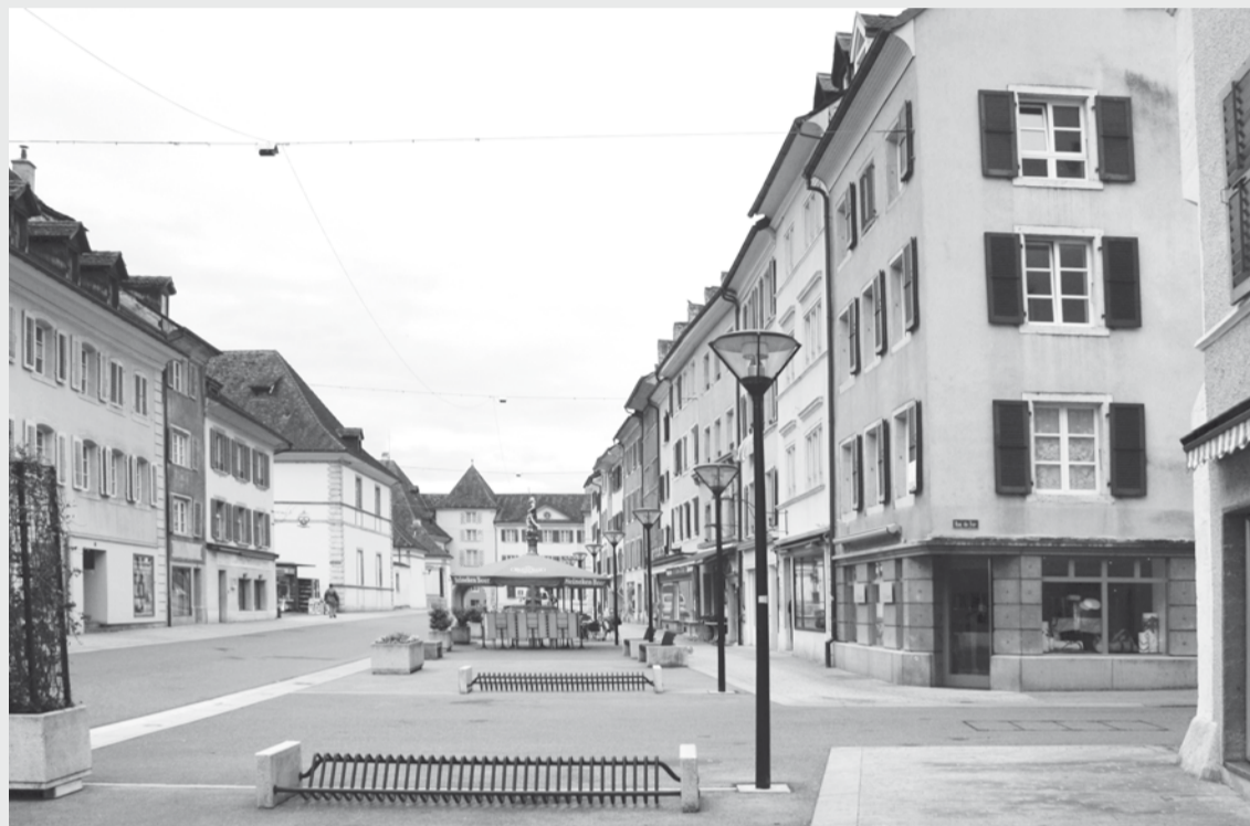
▼ LA RUE DU 23-JUIN EN 2009