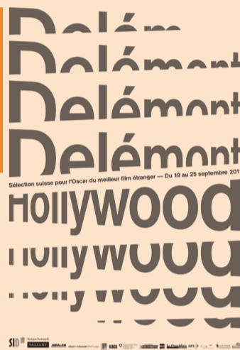
Sélection suisse pour l'Oscar du meilleur film étranger - Du 19 au 25 septembre 2011

La Guilde suisse des restaurateurs organise le 3 septembre sa traditionnelle « Journée risotto ». C'est plus de 2 tonnes de riz qui va cuire dans les poêles installées dans les rues et les places de 40 villes. Les restaurateurs vendront des portions de risotto, d'une valeur de 9 francs, au profit de la Société Suisse de Sclérose en plaques. L'an dernier, c'est ainsi 100'000 francs qui ont pu être reversés à l'association. Rappelons qu'en Suisse 10'000 personnes sont atteintes de la SEP, l'une des maladies les plus sournoises et actuellement encore incurables. La Société SEP (CCP 10-10946-8) poursuit 3 buts principaux : elle s'engage pour une plus grande autonomie des