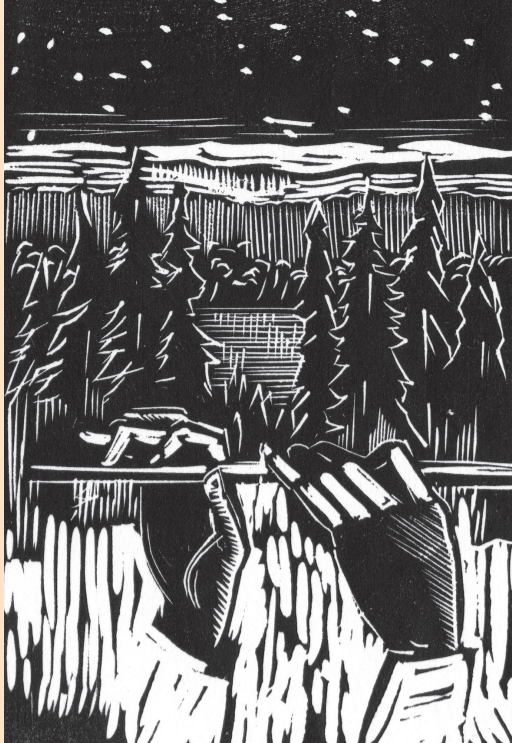
UN AIR DE FLÛTE, NOËL 1981, GRAVURE DE LAURENT BOILLAT.

Dès 1950 et jusqu'en 1984, à chaque fin d'année, Laurent Boillat adressait à ses proches une gravure originale en lien avec la fête de la Nativité.