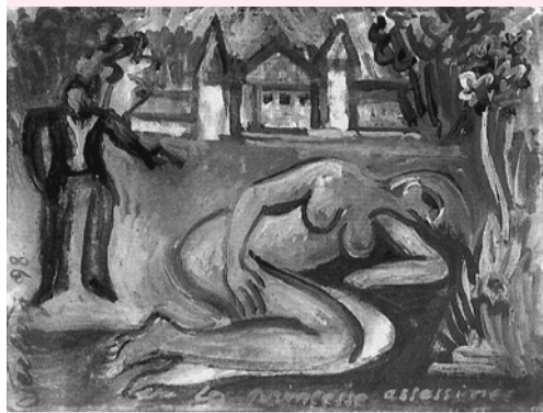
La princesse assassinée

22 mars - 10 mai 1998 Peintures récentes