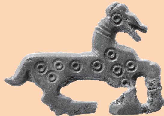
FIBULE EN BRONZE, 7 e SIÈCLE, DÉCOUVERTE À DEVELIER-LA PRAN