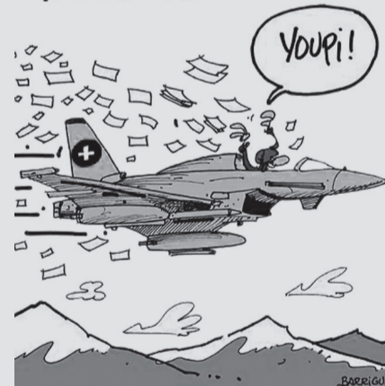
BARRIGUE SIGNE CE DESSIN EN 2010...

NOUVEAUX AVIONS DE COMBAT VOTRE ARGENT PAR LA FENÊTRE