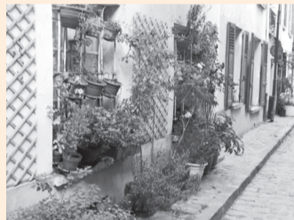
EXEMPLES DE VILLES FLEURIES

URBANISME, ENVIRONNEMENT, TRAVAUX PUBLICS (UETP)