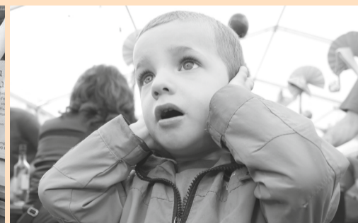
Durant les discours des maires de Pleigne et Delémont...