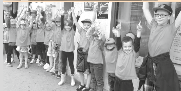
L'avenir de Pleigne, ce sont eux!