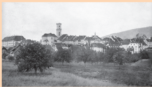
Delémont, photographie d'Edouard Quiquerez, vers 1860

Les premières photographies de localités et de sites du Jura