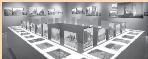
Vue de l'exposition « Dans l'oeil d'Édouard »

Tous les détails sous: www.mjah.ch Musée jurassien d'art et d'histoire - Rue du 23-Juin 52 - 2800 Delémont 032 422 80 77 - contact@mjah.ch - Ma-Ve 14h-17h - Sa-Di 11h-18h