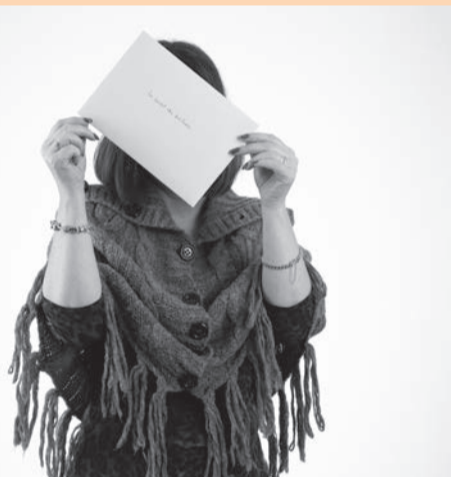
L'un des « objets » reçu: une enveloppe de transmission du secret des brûlures, une pratique bien vivante attachée au Jura.

Le temps d'un été, nous vous proposons de découvrir les objets, documents ou photographies apportés par une cinquantaine de personnes. Des pièces qui racontent une histoire qui les a touchés et qui permet de mettre en valeur une facette de ce jeune canton.