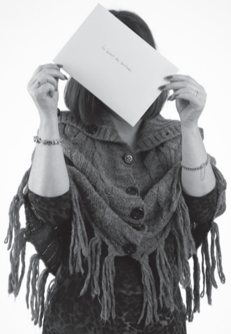
L'un des « objets » reçu: une enveloppe de transmission du secret des brûlures, une pratique bien vivante attachée au Jura.

Le temps d'un été, nous vous proposons de découvrir les objets, documents ou photographies apportés par une cinquantaine de personnes. Des pièces qui racontent une histoire qui les a touchés et qui permet de mettre en valeur une facette de ce jeune canton.