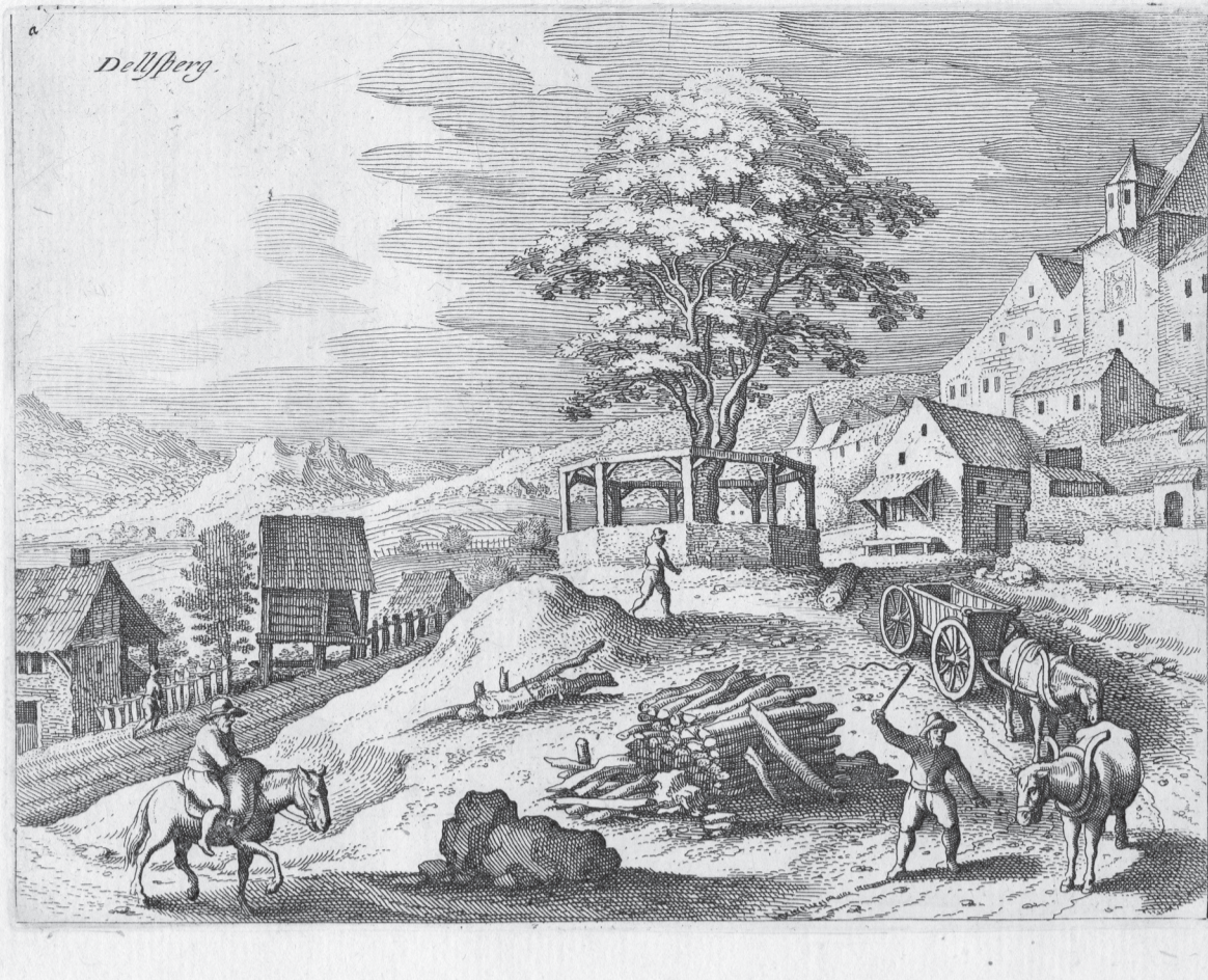
Cras des Moulins en 1620. Tilleul des plaids.

À droite: Porte des Moulins décorée des armoiries de Delémont.