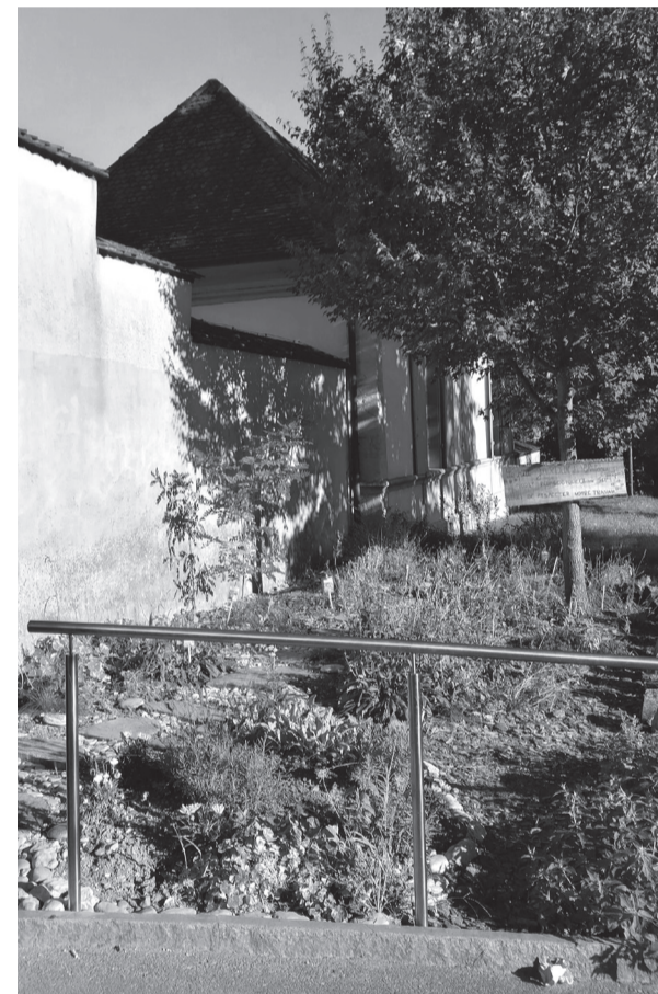
Service de l'urbanisme, de l'environnement et des travaux publics (UETP)